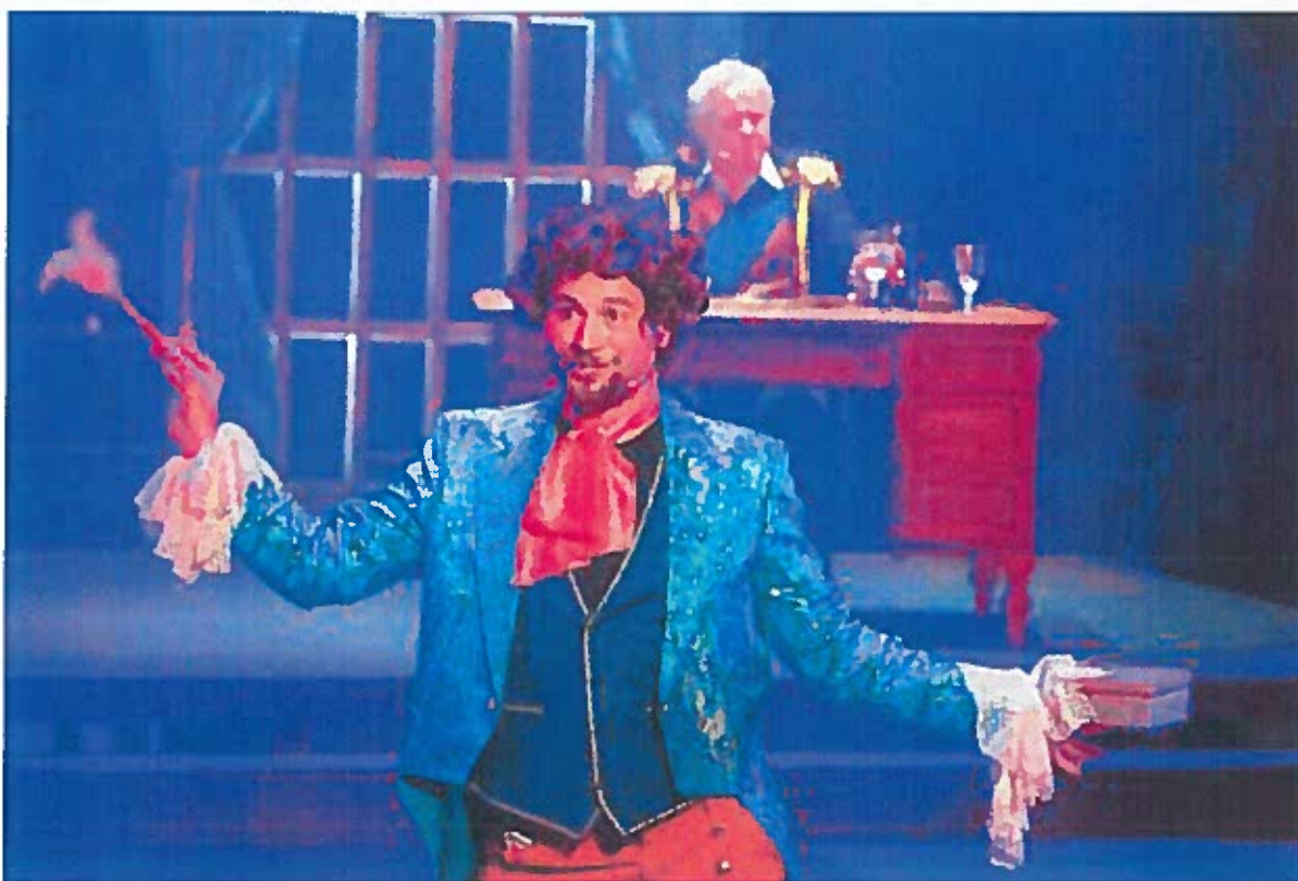
– A legszebb látvány díját a Cinderella című ExperiDance Produkció érdemelte ki;